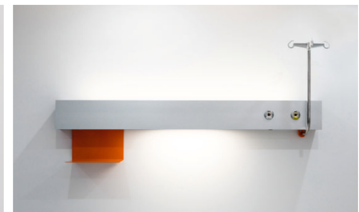
światło pacjenta i światło ogólne