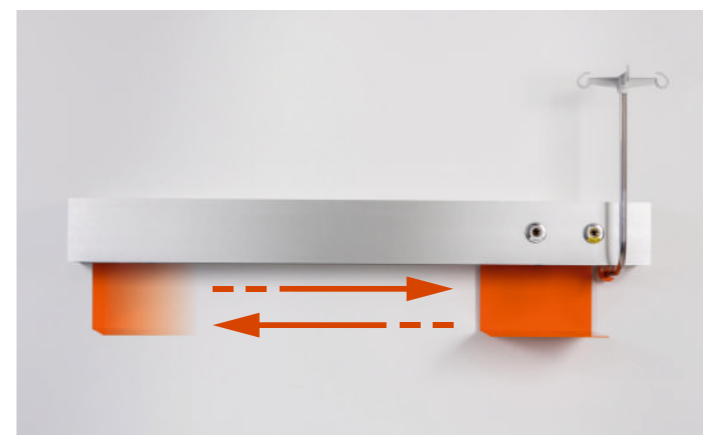
przesuwne akcesoria na całej długości